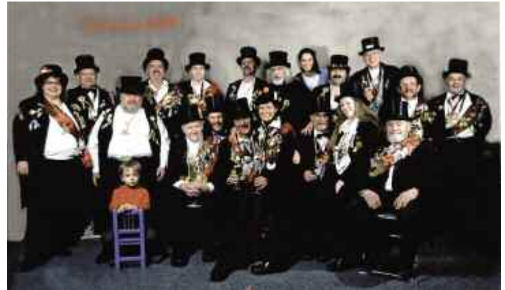
...am 3. Gunglhos und am Seniorennachmittag erfreuen die Schindauer uns mit ihren berühmt-berüchtigten Episoden und Liedern.