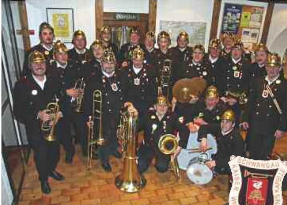
Die immer wieder beliebte KWK wird 2010 am 1. und 2. Gunglhos mit ihrem Temperament die Zuschauer von den Sitzen reißen ....